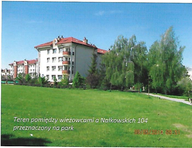
Teren pomiędzy wieżowcami a Nałkowskich 104 przeznaczony na park