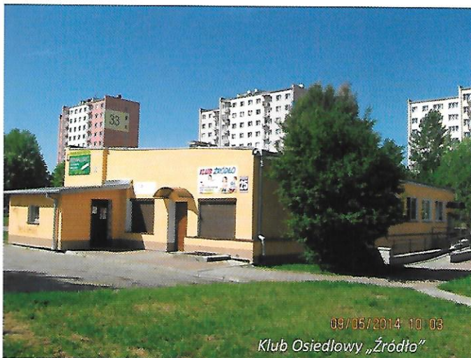
Klub Osiedlowy „Źródło”