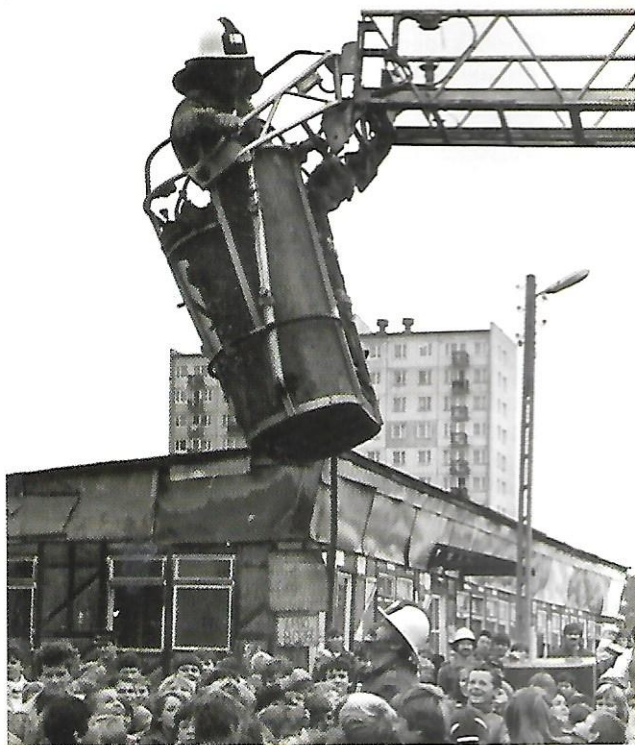
Centrum Osiedla Nałkowskich – pokazy Straży Pożarnej