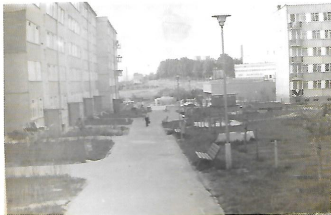
Alejka przy Nałkowskich 100 prowadząca do Pawilonu handlowego przy ul. Samsonowicza 1