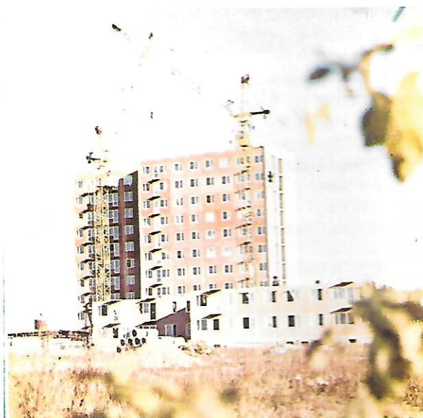
Budowa wieżowców Samsonowicza 15 i 17