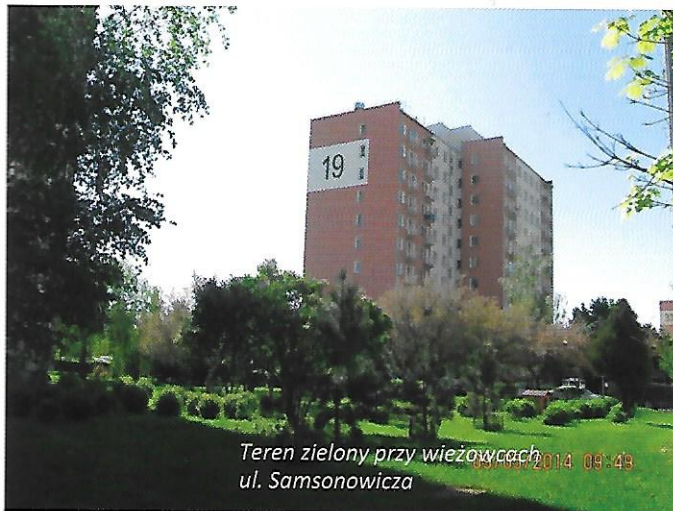
Teren zielony przy wieżowcach ul. Samsonowicza