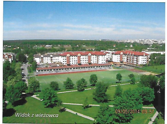
Widok z wieżowca