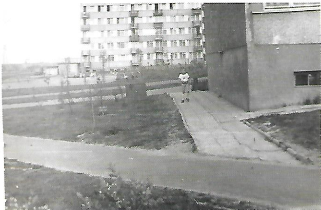
Przeście pomiędzy blokami Nałkowskich 96 i Nałkowskich 100, w oddali Samsonowicza 5

A oto kilka zdjęć historycznych naszej Spółdzielni :