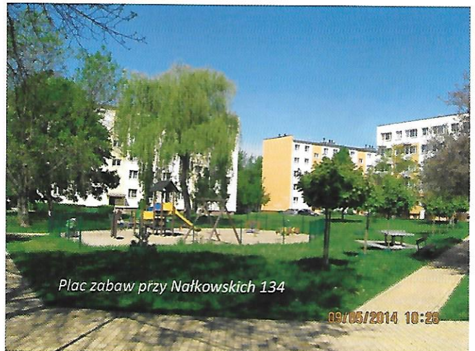
Plac zabaw przy Nałkowskich 134