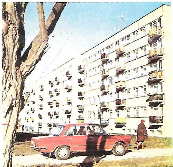
Nałkowskich 118, 120, 122