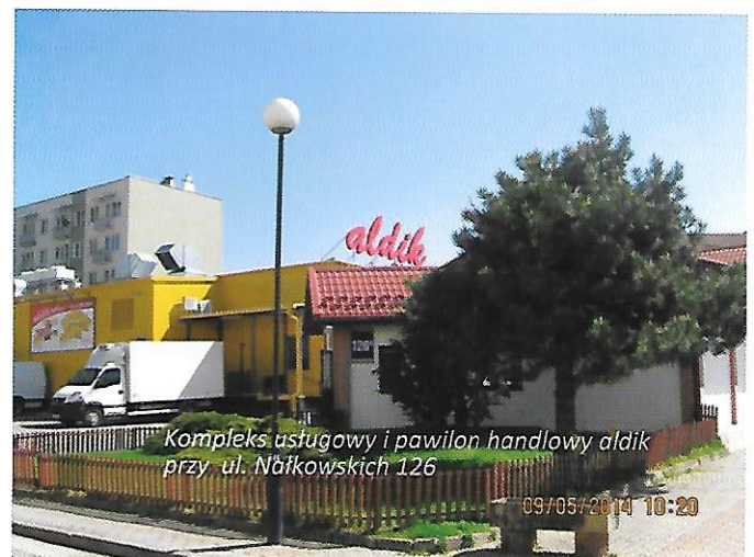
Kompleks usługowy i pawilon handlowy aldik przy ul. Nałkowskich 126