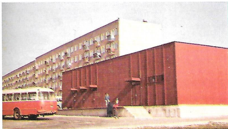
Pawilon handlowy przy Nałkowskich 126