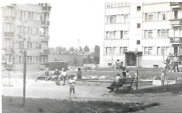
Plac zabaw przy Nałkowskich 96, 98 i 100