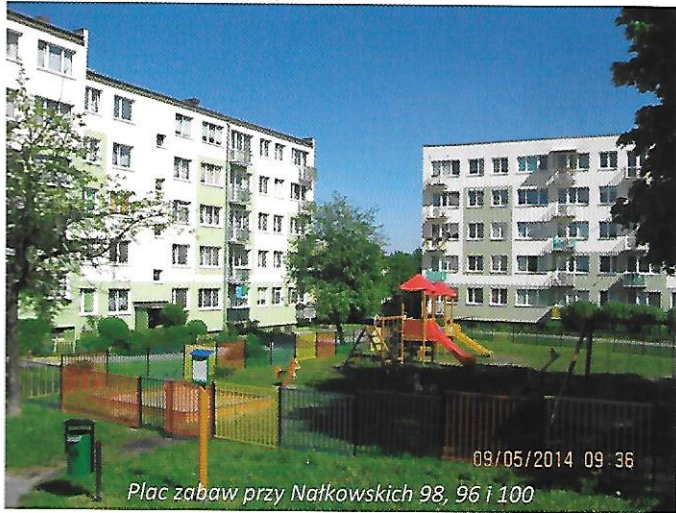
Plac zabaw przy Nałkowskich 98, 96 i 100