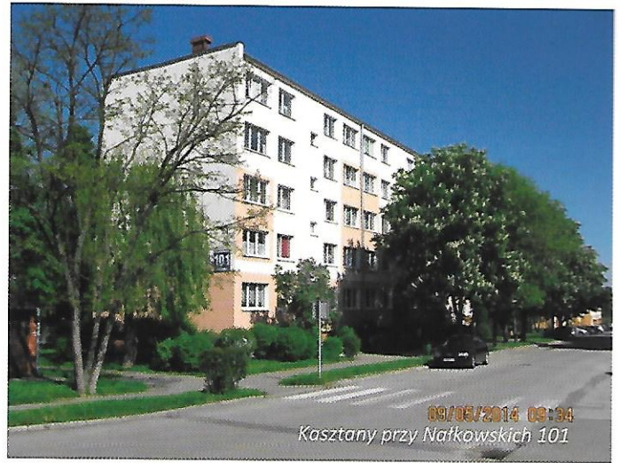
Kasztany przy Nałkowskich 101